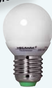
MM 05112i / 5W MM05113i / 7W