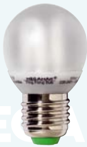
MM 19102i / 5W MM 19112i / 7W