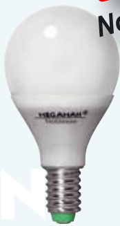
MM 05103i / 7W