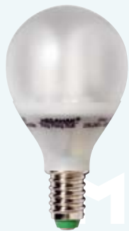
MM 18102i / 5W MM 18112i / 7W

setzen Sie Akzente in Ihre Wohnung mit unseren "Dekorativen Energiesparlampen" aus der Ping Pong Noblesse Serie.